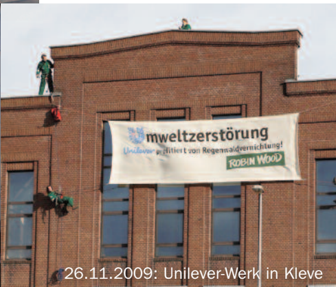
26.11.2009: Unilever-Werk in Kleve

Neben Unilever ist Wilmar der Schlüssel zum Weltmarkt. Deshalb wollen wir Wilmar nicht nur an den Palmöl-Fabriken in Deutschland, sondern auch an den Plantagen auf Kalimantan „bearbeiten“. In jedem Fall wollen wir verhindern, dass Wilmar auch die 130.000 Hektar Tropengebiet vernichtet, das jetzt noch existieren. Mit Hilfe von „Save Our Borneo“ wollen wir das Gebiet überwachen, den