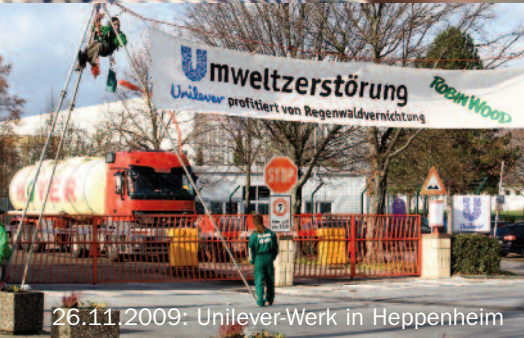
26.11.2009: Unilever-Werk in Heppenheim

Ein Viertel des Palmöl-Welthandels kontrolliert Wilmar. Inzwischen haben wir auch die Raubbau-Methoden von Wilmar bekannt gemacht. Henkel verzichtet deshalb von sich aus vorerst auf Wilmar-Palmöl. Zu den globalen Marktführern gehört auch Unilever, weltweit die Nummer 1 der Palmölverbraucher! Unilever beharken wir seit August sehr konsequent und intensiv. Alle Aktionsfotos stammen aus dem letzten Quartal! Und mit Ihrer Hilfe werden wir noch intensiver.