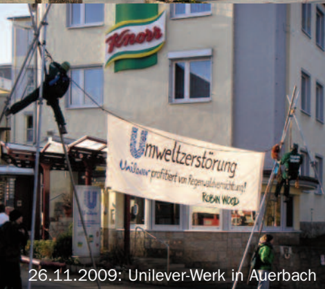
26.11.2009: Unilever-Werk in Auerbach