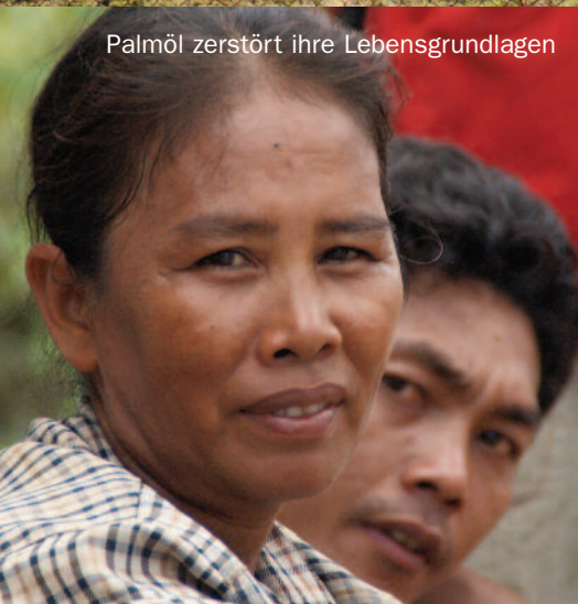
Palmöl zerstört ihre Lebensgrundlagen