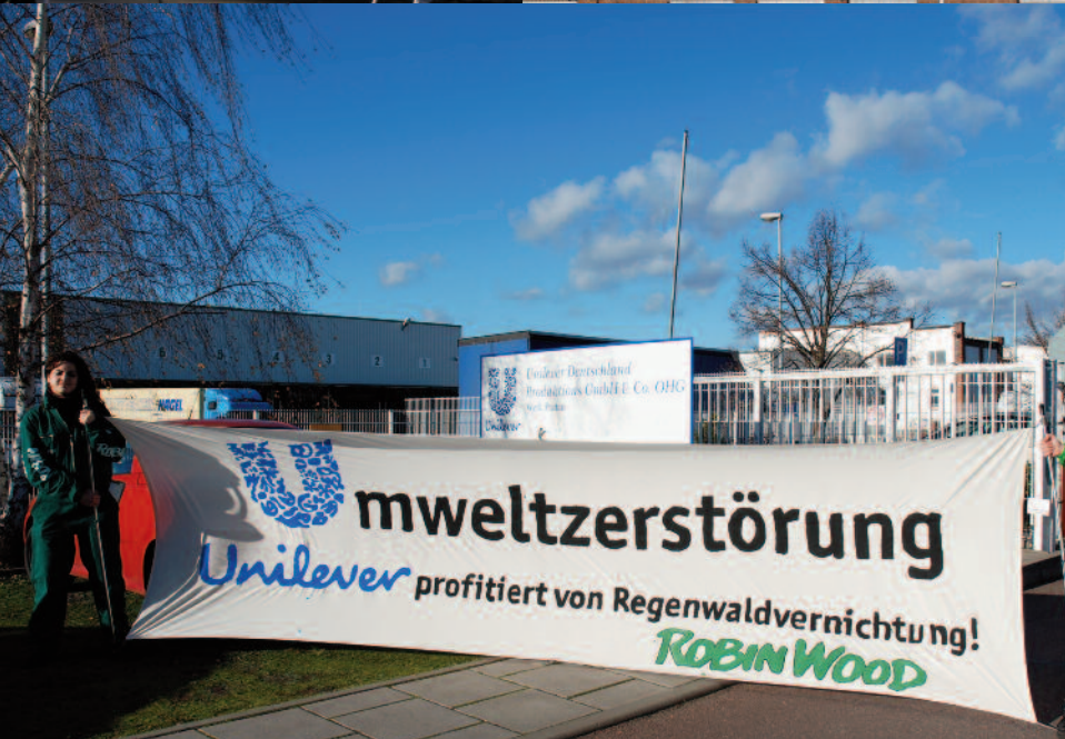
26.11.2009: Rama-Werk in Pratau

Für Wilmar-Plantagen wurden große Teile der Tropenwälder auf Kalimantan bereits zerstört. Nun will sich der Raubbau-Konzern auch die letzten Tropengebiete im Süden der Insel unter den Nagel reißen. Gemeinsam mit „Save Our Borneo“ wollen wir das verhindern: mit konzertierten Aktionen auf Kalimantan und in Europa.