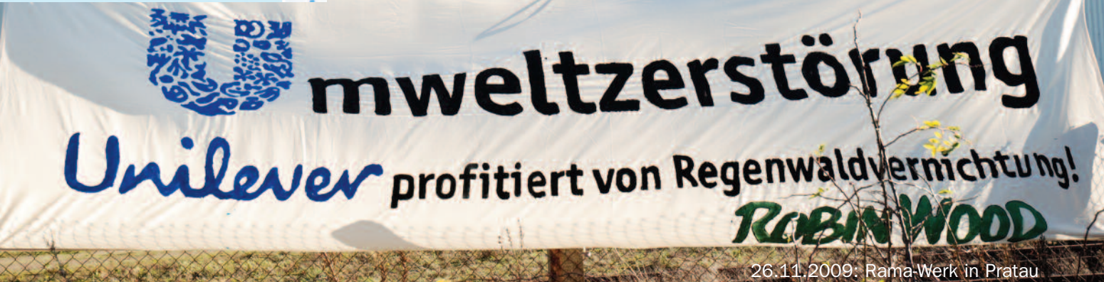
26.11.2009: Rama-Werk in Pratau