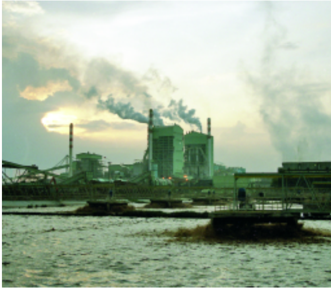
Wie Zellstoff- und Papierkonzerne den Regenwald auf Sumatra zerstören...