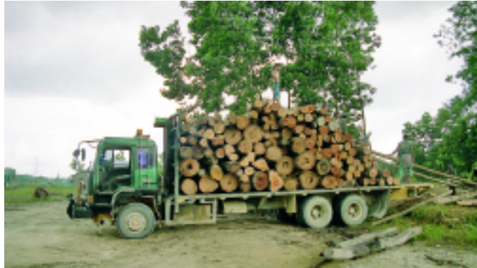
...Die Folgen für den Menschen und die Umwelt...