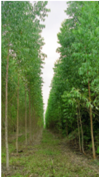
...Warum Plantagen keine Wälder sind...